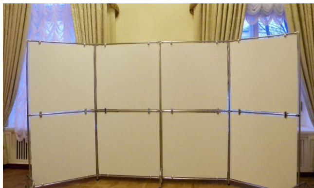
Примерный вариант: Стенд экспозиционный