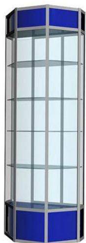
Примерный вариант: Витрина экспозиционная