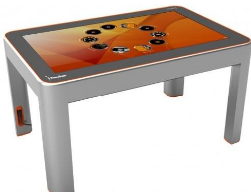
Примерный вариант: Интерактивный сенсорный стол